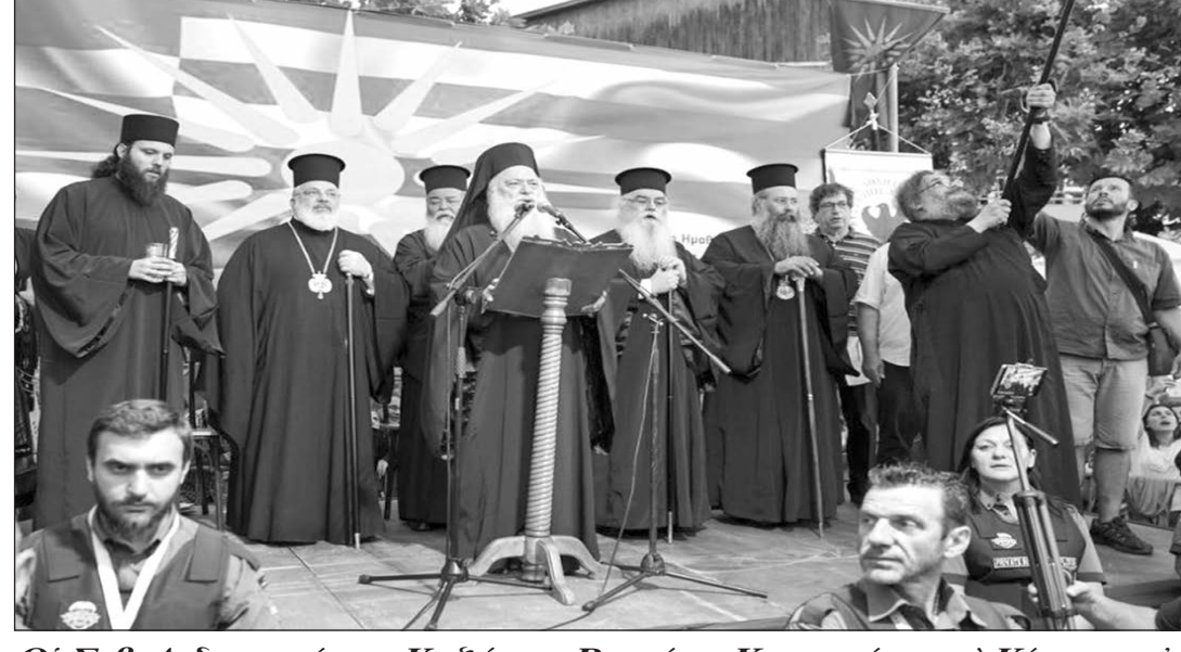
Οἱ Σεβ. Διδυμοτεῖχον, Κοζάνης, Βεροίας, Καστορίας καὶ Κίτρους εἰς τὸ πρόσφατον μεγαλειώδες συλλαλητήριον εἰς Βεργίναν (09.07.2018)